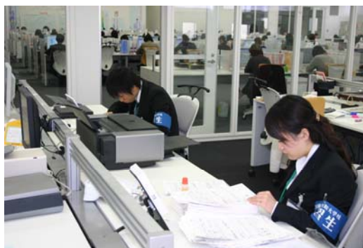
企業実習（杉養蜂園さんにて）