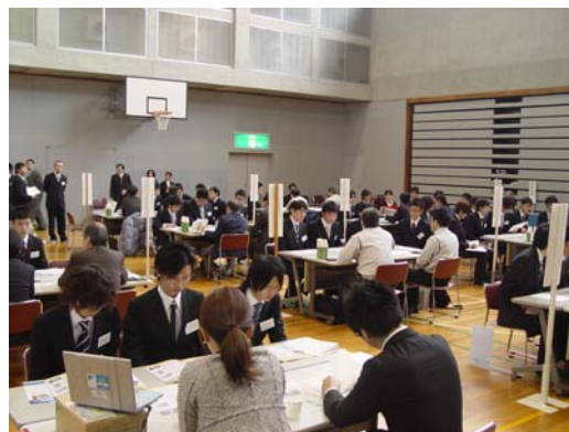
企業面談会（本校体育館・講堂）

厳しい就職事情の中、企業側がより優秀な人材を厳選しており、一次試験の筆記や作文等で不合格になるケースが増えてきました。さらに、面接におけるコミュニケーション不足も指摘されていることから、これらに対応するため、1年次の早期から、放課後に各クラスで筆記試験・作文、面接、企業研究、自己分析などの支援策を強力に指導しています。