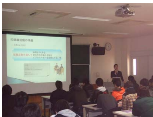
就職講話（本校大講義室）